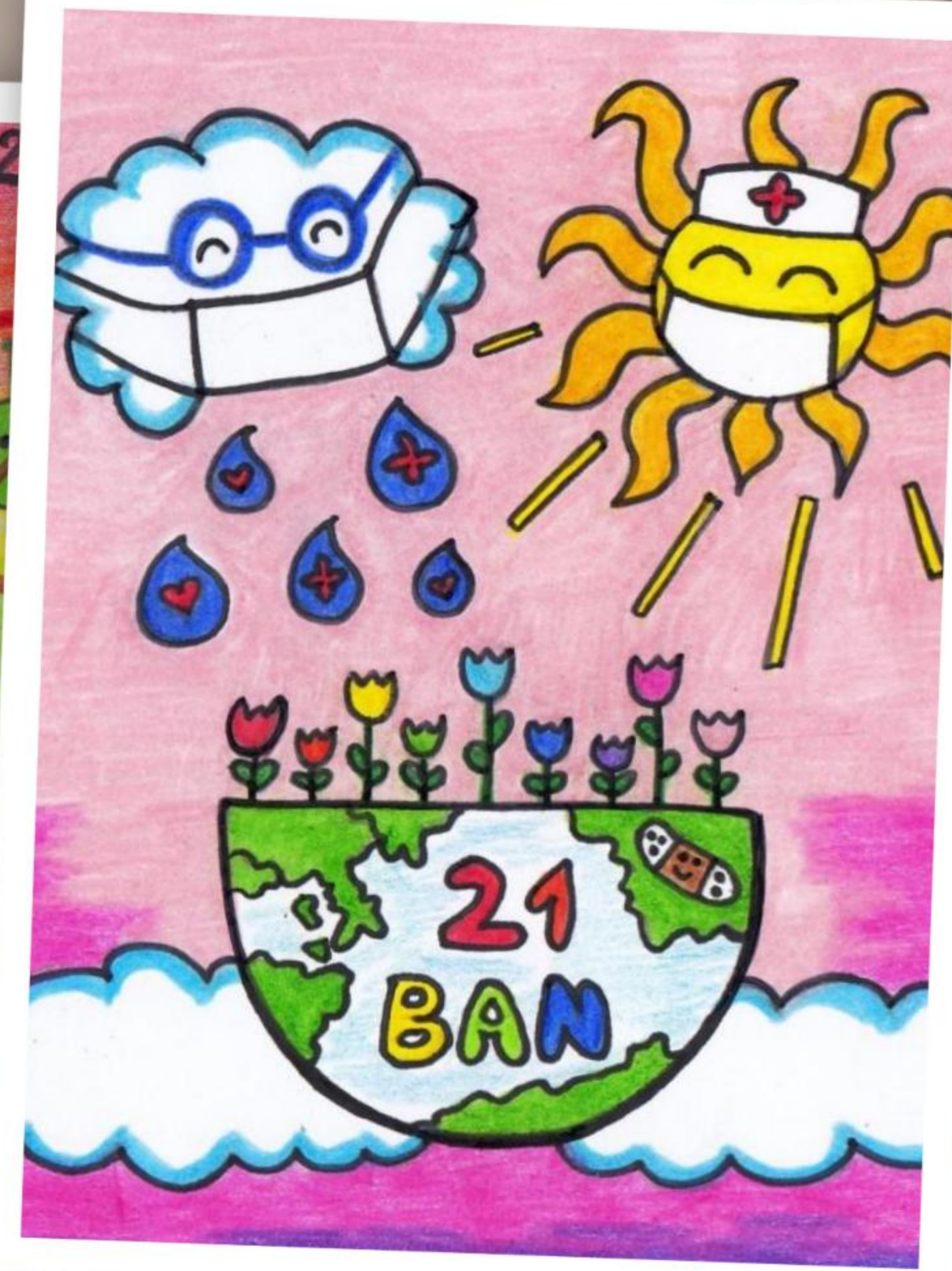
Concorso "Inventiamo una banconota"