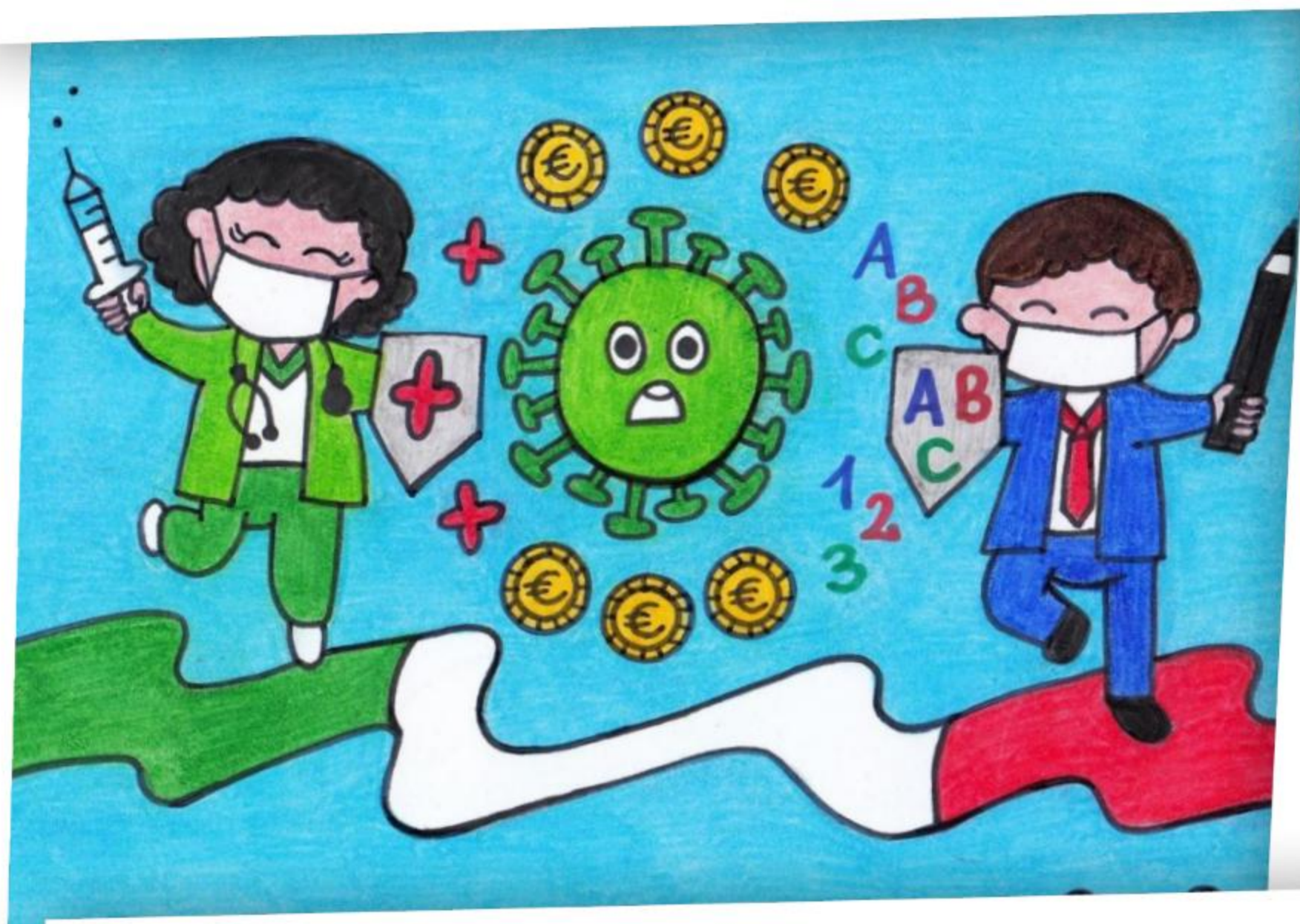
1B Primaria Frasso Telesino